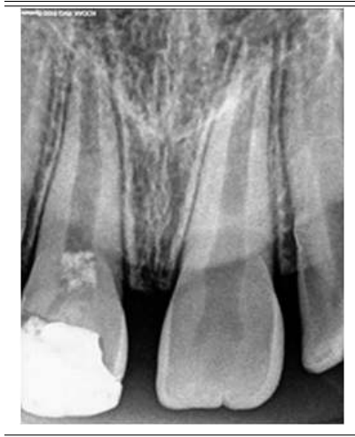
Fig. 2. Radiografía a 10 meses. Formación radicular casi completa

El paciente no regresa a la cita de control programada. Acude a consulta 10 meses después por presencia de dolor intenso en arcada anterior superior. Se realizan pruebas de diagnóstico y el OD11 responde positivo a percusión, negativo a frío y calor. Observamos cambio de color. Tejidos periodontales normales sin inflamación ni presencia de tracto sinuoso. En el examen radiográfico observamos el desarrollo radicular casi completo, solo existe una ligera apertura en el área apical. (Fig.2) Por lo que el diagnóstico actual es necrosis pulpar con periodontitis apical sintomática.