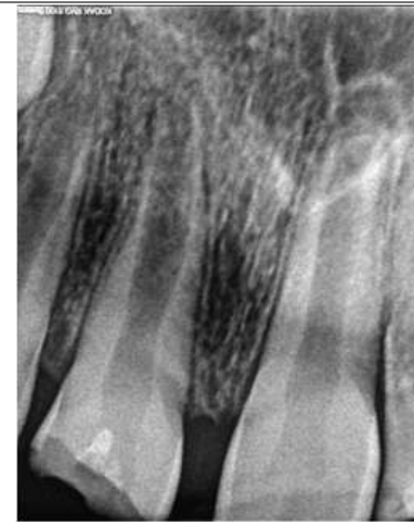
Fig. 1. Radiografía inicial

Al realizar pruebas diagnósticas de rutina encontramos: