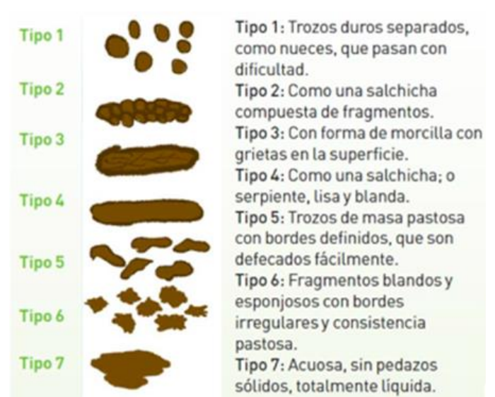
Figura 2. Escala de forma de las heces de Bristol. Fuente: Lacy BE, Mearin F, Chang L, et al. Bowel disorders. Gastroenterology 2016;150:1393-407.

nal rápido, 24 además de esto es importante investigar la sensación de evacuación completa o incompleta según sea el caso y que tan frecuente es así, se debe interrogar también sobre el uso de laxantes, uso de supositorios o enemas y de irrigaciones colónicas, que tan frecuente se usan de ser el caso y que tan útiles son para mitigar los síntomas. 9,25