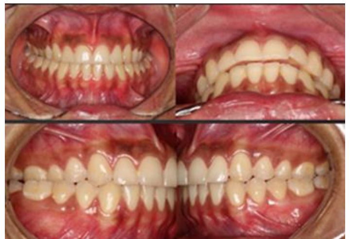
Figura 1. Fotografías intraorales. La paciente presenta mordida posterior cruzada bilateral marcada, colapso maxilar y clase I molar y canina derecha e izquierda.

Presentación de caso: Paciente de 23 años de edad con mordida cruzada posterior bilateral, a causa de deficiencia transversal del maxilar y se decide colocar un disyuntor asistido con mini implantes (de la Figura 1 a la Figura 6). La paciente refiere haber tenido un tratamiento previo de brackets sin resultados y tener problemas para respirar. Presenta ronquidos por las noches y padece de alergias.