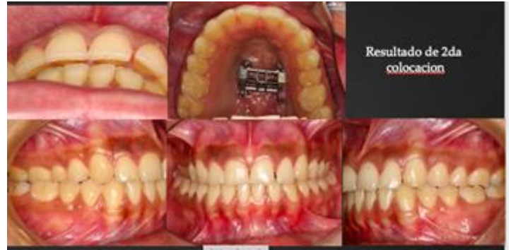
Figura 6. Fotografías intraorales. Se observa que posterior a la segunda colocación el cuadrante superior derecho, aun no desarticula por completo, por lo cual se realiza una nueva colocación, observando notable mejoría en el colapso maxilar, además de que la paciente nos refiere que ha tenido mejoría en su respiración bucal.