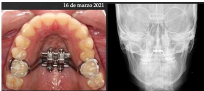
Figura 4. Se realizan 4 micro-perforaciones a nivel de la sutura media palatina, para facilitar su desarticulación y se activa con 2 vueltas en el consultorio. Se le indica a la paciente activarlo 1 vez al día. a.) Fotografía intraoral oclusal donde se observa el tornillo en la bóveda palatina con anclajes. B.) Fotografía de radiografía mostrando la colocación del tornillo correctamente en los huesos palatinos.