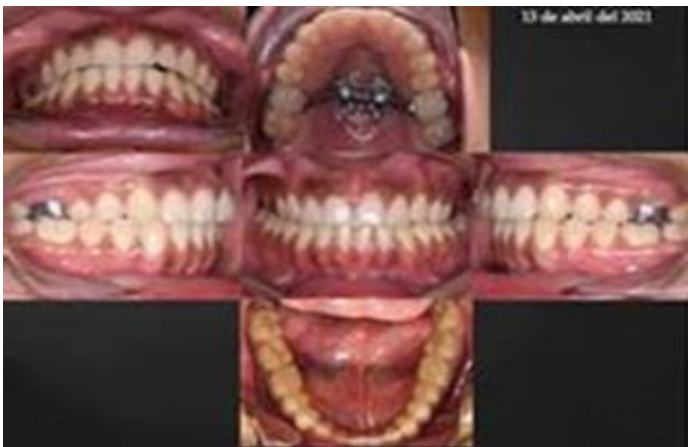
Figura 5. Fotografías intraorales, donde se muestra que al completar el máximo número de activaciones del tornillo se observa el diastema en la parte superior, en el lado izquierdo se observa cómo se desarticula la mordida y el lado derecho permanece igual.