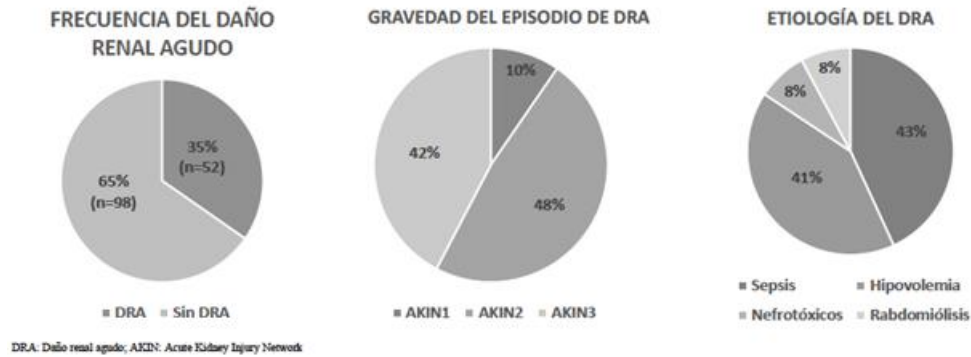
Figura 2. Frecuencia, clasificación y etiología del daño renal agudo