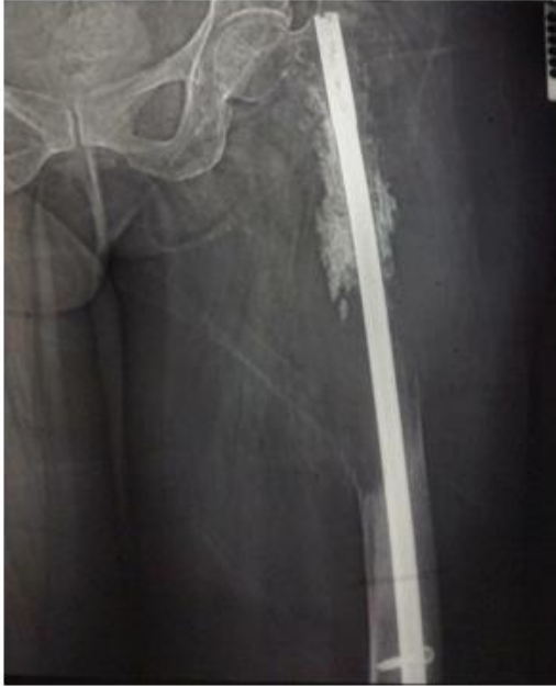
Figura 1. Rx AP de fémur izquierdo que muestra lesión lítica extensa con destrucción de corticales y clavo centromedular anterógrado.

La TAC de fémur izquierdo corroboró la lesión lítica con reacción perióstica discontinua, invasión a partes blandas, con una extensión de la lesión de 26.79 cm. La gammagrafía ósea mostró gran aumento de la captación del contraste compatible con proceso maligno a ese nivel, sin afectación ósea a otros niveles (Figura 2).