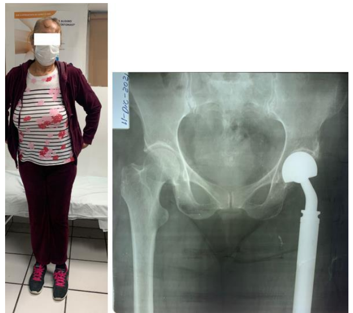
Figura 4. Fotografía clínica de seguimiento del paciente. Bipedestación con apoyo total tras 9 meses de evolución postquirúrgica (A). Rx AP de pelvis. Con prótesis de cadera izquierda colocada en adecuada situación, sin cambios respecto a Rx posquirúrgica inmediata (B).

La evaluación funcional se realizó utilizando la clasificación funcional establecida por la Sociedad Internacional de Salvamento de Miembros y la Sociedad de Tumores Musculoesqueléticos (MSTS), con un puntaje de 25 puntos (Cuadro 2).