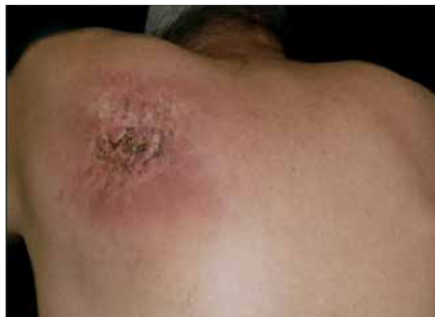
Figura 1. Región escapular izquierda con eritema, pigmentación, esclerosis y fisuras.

Para estudiar la lesión se realizó una biopsia incisional de la placa donde se tomaron áreas de esclerosis y fisuras. Los cortes histológicos teñidos con hematoxilina y eosina mostraron una epidermis con ulceración superficial, presencia de fibrina y detritus celulares, acantosis irregular con atrofia de manera focal. En la dermis superficial y media se observó aumento del grosor de las fibras de colágeno, extravasación eritrocitaria e infiltrado linfocitario disperso, así como fibroblastos atípicos estrellados. Se hizo diagnóstico de radiodermatitis crónica. Durante el seguimiento del paciente no se reportaron cambios que