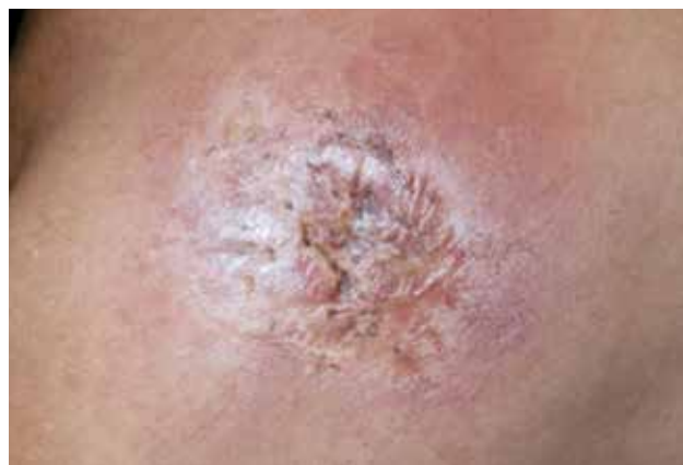
Figura 2. Placa de radiodermatitis secundaria a fluoroscopia.

sugirieran malignidad en biopsias subsecuentes, realizadas para descartar carcinoma espinocelular.