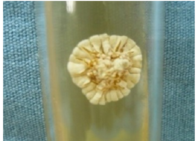
Figura 4. Colonia limitada de color blanco-amarillento, plegada, con aspecto de “palomita de maíz” en medio de cultivo agar Sabouraud sin antibiótico.

Con base a los datos clínicos, examen directo y cultivo, se diagnosticó actinomictoma por Nocardia brasiliensis , por lo que se inició tratamiento con Amoxicilina/clavulanato 500/125 mg cada 8 hr y diaminodifenilsulfona 100 mg cada 24 hr, hasta la negativización micológica y remisión completa de las lesiones a los 4 meses, quedando una placa atrófica residual en la cara posterior de la pierna (figura 5).