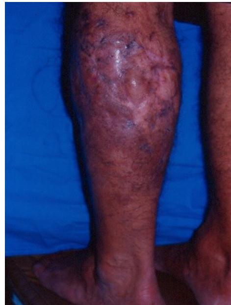
Figura 5. Placa atrófica residual en cara posterior de pierna izquierda a los 4 meses de tratamiento.