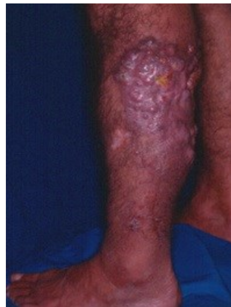
Figura 1. Lesión en extremidad inferior izquierda caracterizada por aumento de volumen, deformidad anatómica y fístulas que drenan material filante con presencia de granos.

A la exploración física, se observa una dermatosis localizada a extremidad inferior izquierda de la que afecta pierna en cara posterolateral, unilateral y asimétrica, constituida por aumento de volumen, deformidad anatómica y fístulas que drenan material purulento, filante con presencia de granos que confluyen formando una placa de 10x20 cm, bordes mal definidos, superficie irregular. Evolución crónica y asintomática (figura 1).